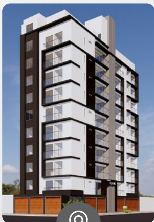
Classic URB. SANTA ELDEMIRA