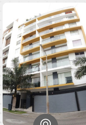
San Rafael URB. HORTENCIAS DE CALIFORNIA