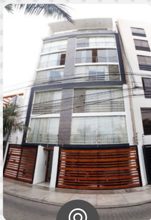
San Gabriel I URB. HORTENCIAS DE CALIFORNIA