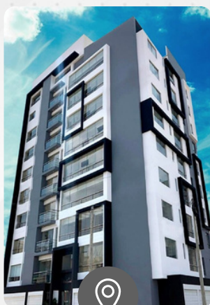
Los Laureles de California URB. LA MERCED