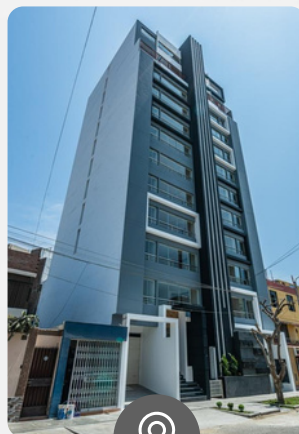
Bosco 825 URB. LA MERCED