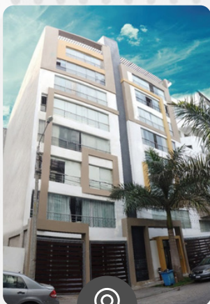
San Gabriel II URB. HORTENCIAS DE CALIFORNIA