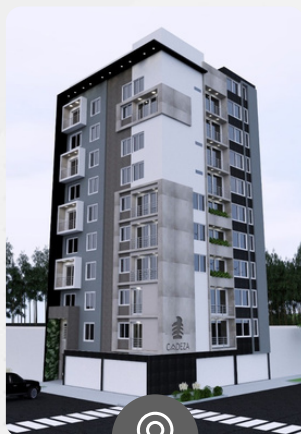
Exclusive 495 URB. CALIFORNIA