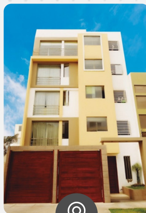
San Gabriel URB. HORTENCIAS DE CALIFORNIA