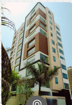
San Gabriel III URB. LA MERCED